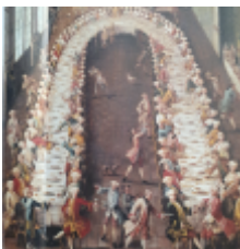
La Vendangeuse, de Guillaume Louis Pécour, 1719