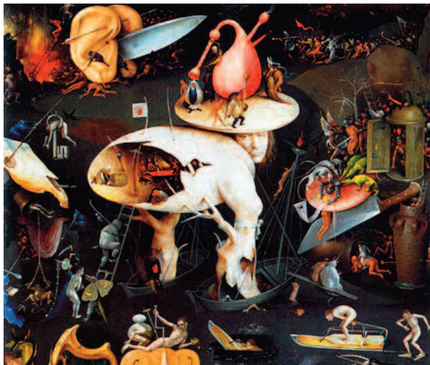
Jérôme Bosch, le jardin des délices